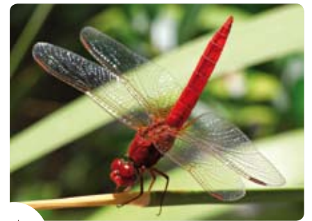
Vuurlibel Crocothemis erythraea .

Natuurlijk! Wij hebben elk op ons eigen niveau een belangrijke rol te vervullen om de uitstoot van broeikasgassen te verminderen. In Brussel vertegenwoordigen gebouwen en transport 90 % van het energieverbruik. Door enkele eenvoudige ingrepen kunnen we onze verwarmingsbehoefte beperken. We kunnen thuis of op het werk de temperatuur bijvoorbeeld lager instellen 's nachts of bij afwezigheid. We kunnen ook de wagen wat meer op stal laten en vaker de fiets of het openbaar vervoer nemen. Al deze ingrepen hebben een rechtstreekse invloed op de uitstoot van broeikasgassen. En we kunnen er onze energiefactuur mee verminderen!