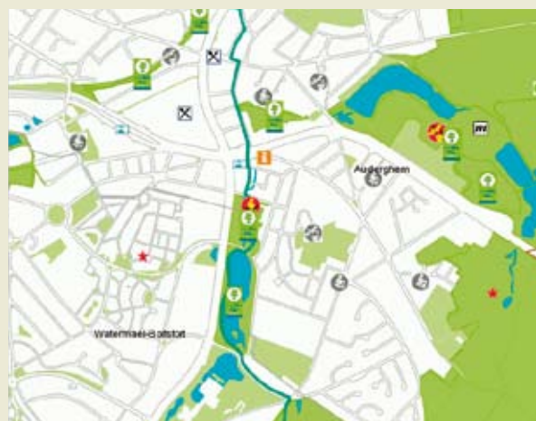
De interactieve onlinekaart.